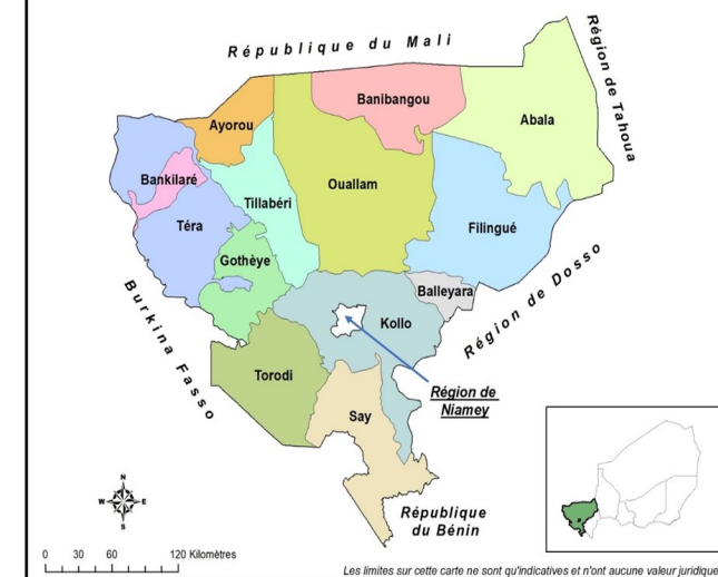
Carte du découpage administratif de la région de Tillabéri

Population de la région de Tillabéri au 1er juillet 2023