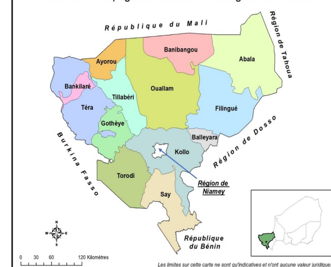
Carte du découpage administratif de la région de Tillabéri

Population de la région de Tillabéri au 1er juillet 2022