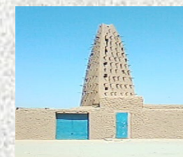
Mosquée Emiskini - Agadez

REGION D'AGADEZ DIRECTION REGIONALE DE L'INSTITUT NATIONAL DE LA STATISTIQUE Tél: +227 20440914, Fax: +227 20440916